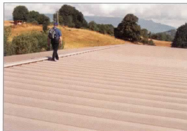
po 20 letech

Po dlouhou dobu si Aluzinkový povlak zachovává svůj vzhled.