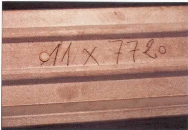
po 16 letech

Na řezných hranách, nebo na povrchu náhodně poškozeném škrábnutím se po několika letech objeví tenká hnědá čára.