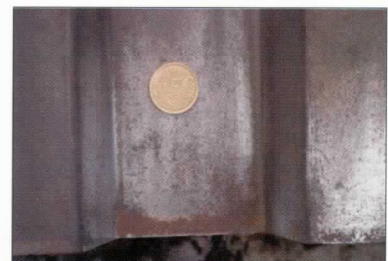
po 28 letech

Díky samohojivé schopnosti Aluzinkového povlaku vznikne po velmi, velmi dlouhé době jen několik milimetrů rudé rzi.